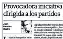
Diario El Comercio 23 de octubre de 2009