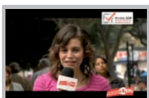
Televisión Nacional del Perú Programa Haciendo Perú PARTE 2