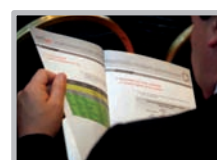
Boletín informativo del INFOgob