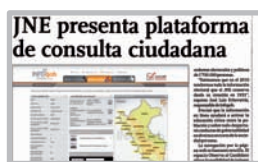
Diario El Comercio 22 de octubre de 2008