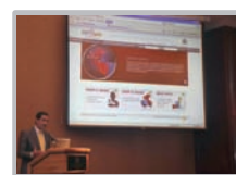
Presentación del INFOgob Lima, 28 de octubre del 2008.