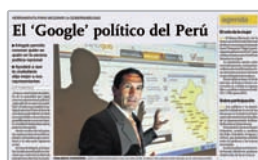
Diario El Comercio 14 de setiembre de 2009