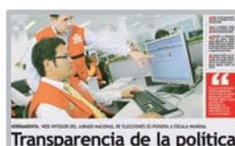
Diario El Peruano 14 de enero de 2009