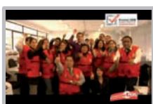
Televisión Nacional del Perú Programa Haciendo Perú PARTE 1